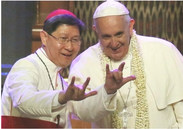
Franziskus und Kardinal Tagle, Manila, 16.01.2015